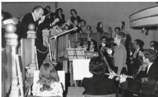
Nino Rota impegnato nell'allestimento della Favola musicale "Lo scoiattolo in gamba".

Seminari, concerti e incontri musicali che si svolgeranno durante tutta la giornata in un articolato programma a cura della Scuola di Didattica del Conservatorio Nino Rota.